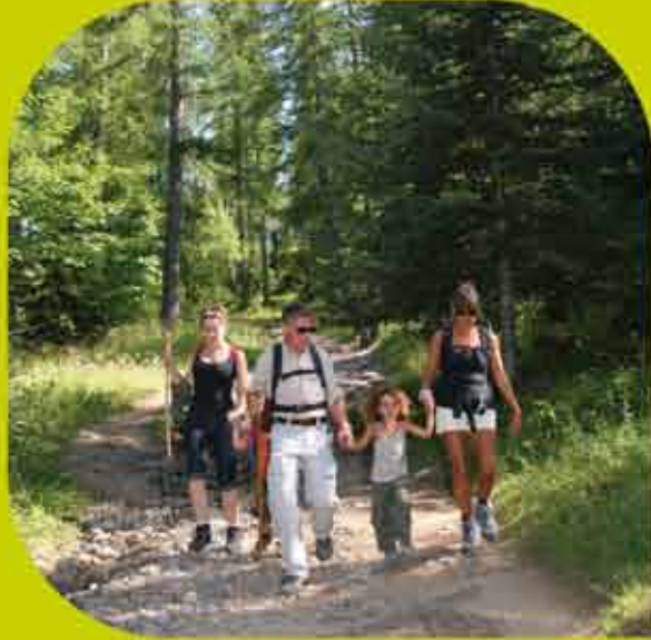
Promenade dans la forêt Hiking in the forest

Discover the real nature without efforts!