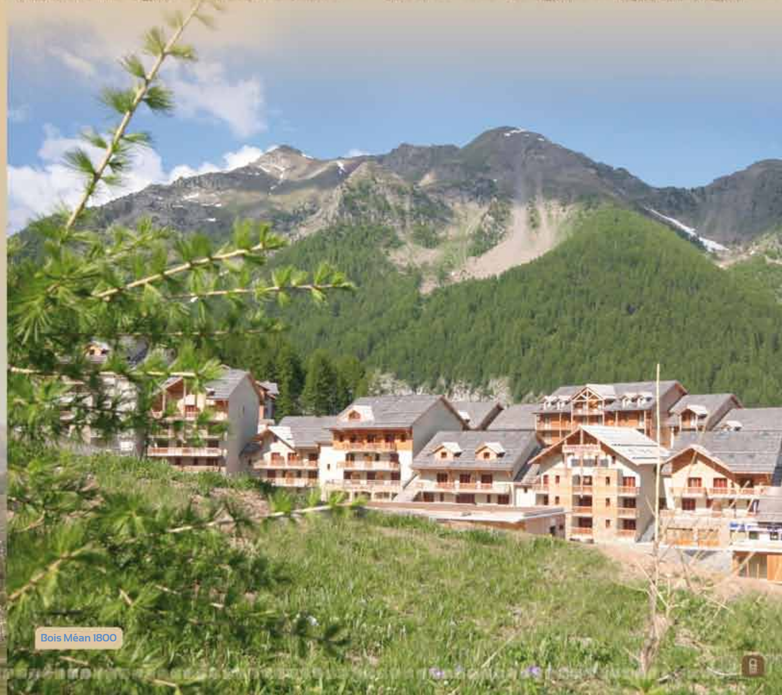
Bois Méan 1800