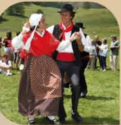
Fête de l'Amontagnage au Grand Vallon

A cultural celebration in the valley "Le Grand Vallon"