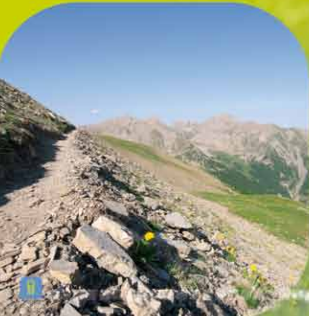
Sentier vers le lac S te Marguerite A hiking trail to the Saint Marguerite Lake