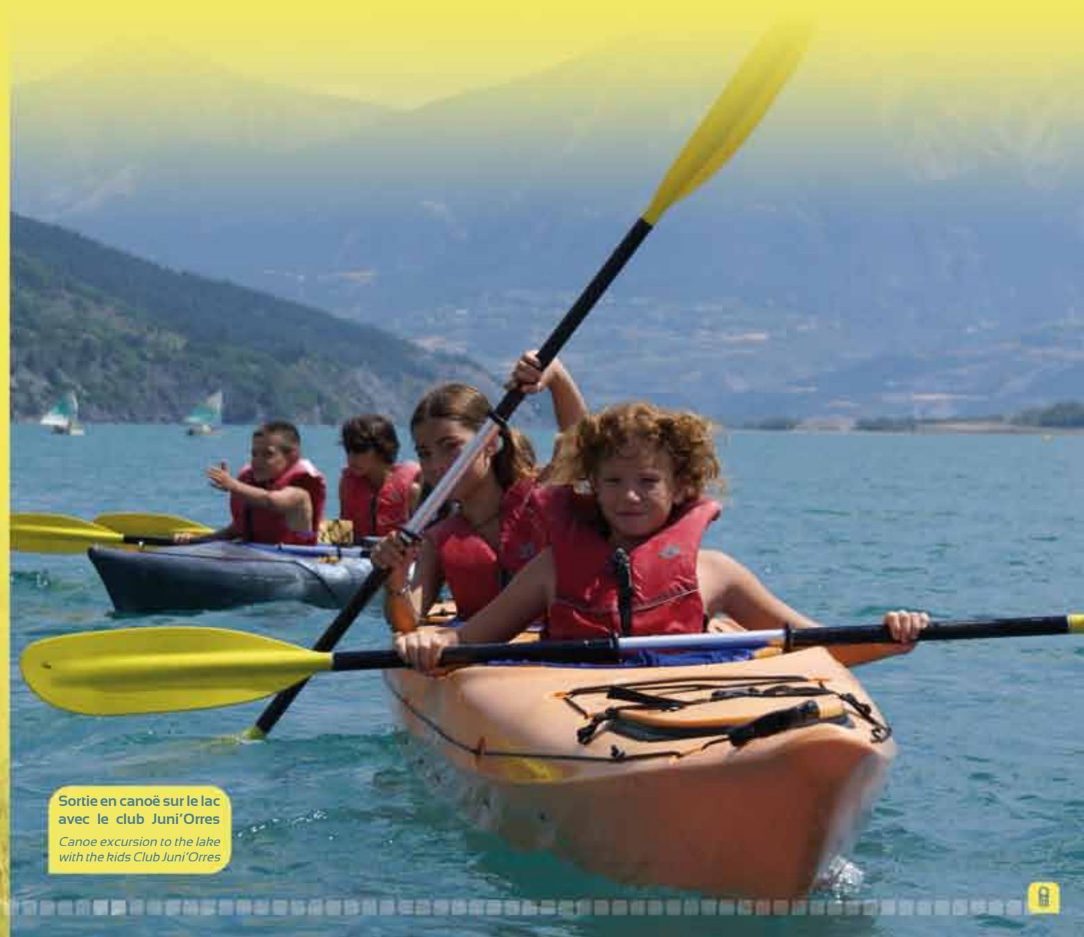
Sortie en canoë sur le lac avec le club Juni'Orres Canoe excursion to the lake with the kids Club Juni'Orres