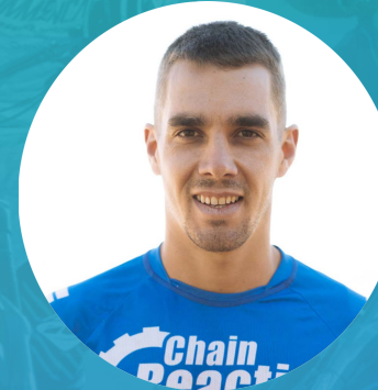
// Sam HILL